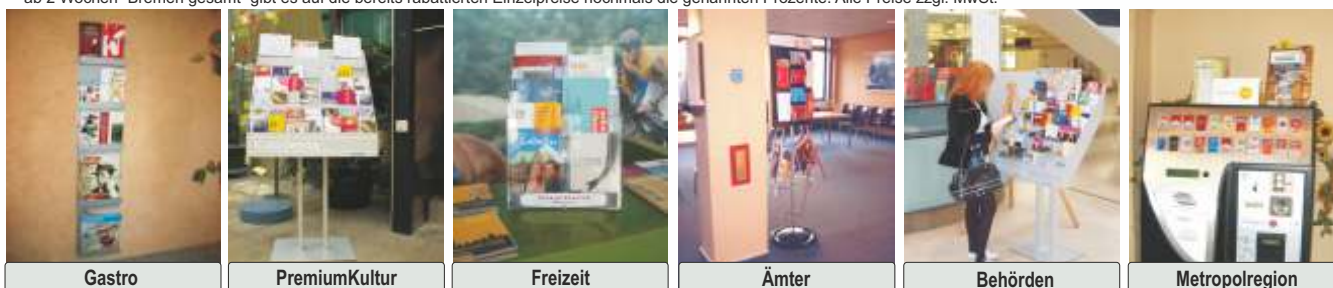
Gastro PremiumKultur Freizeit Ämter Behörden Metropolregion